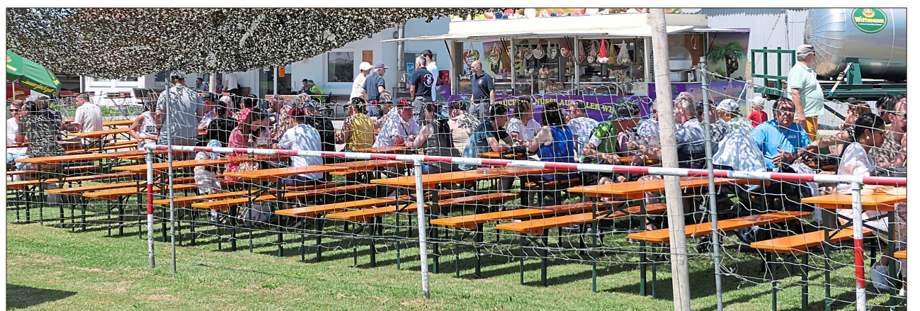
So einige Dingolflinger führte es zum Flugplatz am Wochenende.