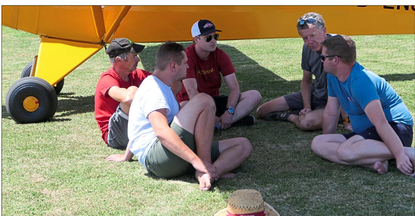
Im Schatten des Flugzeugs legte man eine Pause ein.