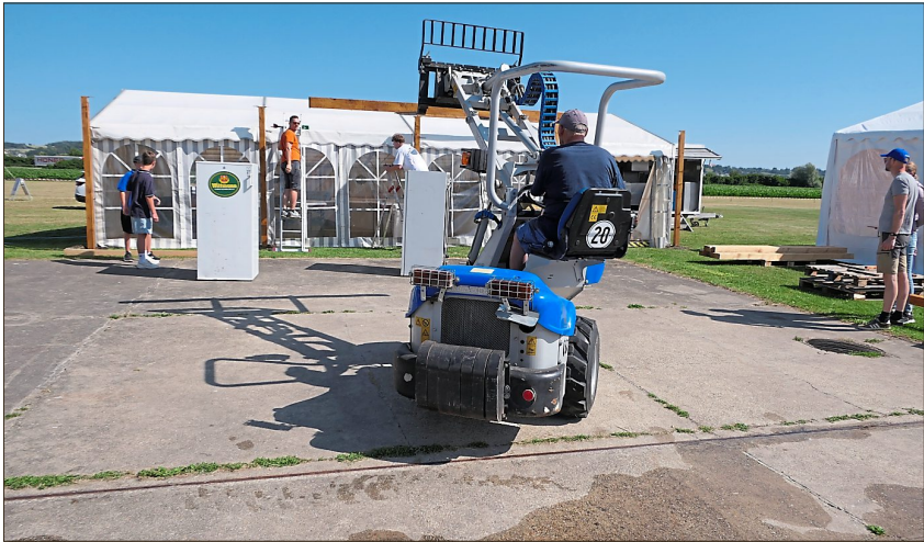
Fleißig war man auch beim Aufbau.