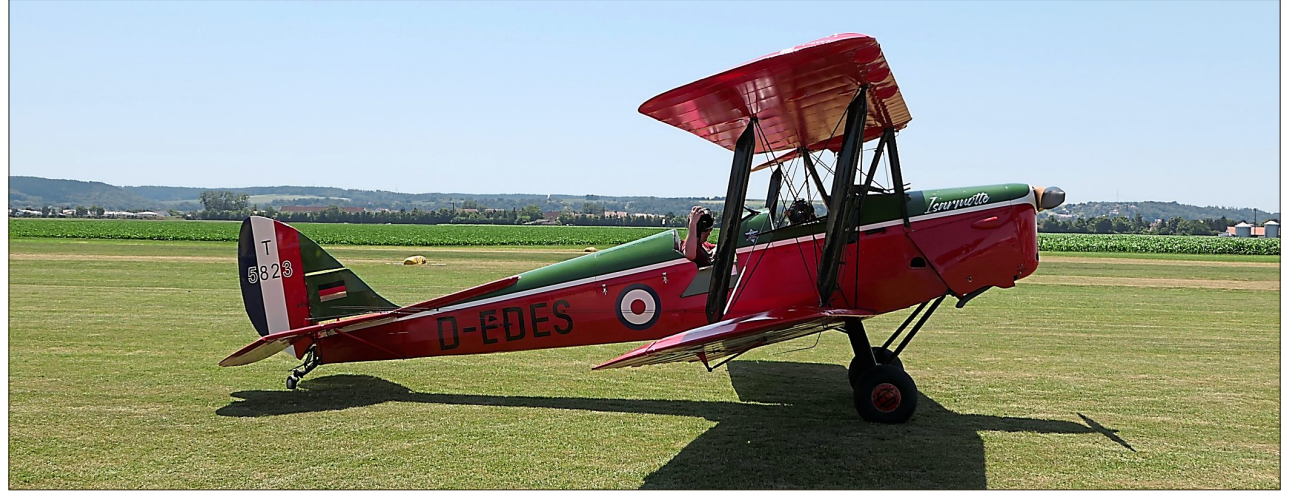
Eines der vielen Flugzeuge, das an diesem Wochenende abhob.