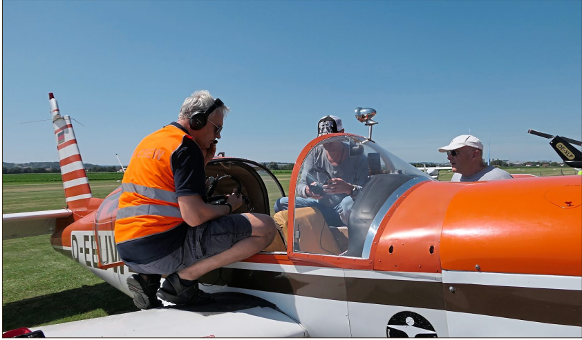
Vor dem Start gab es viel zu besprechen.