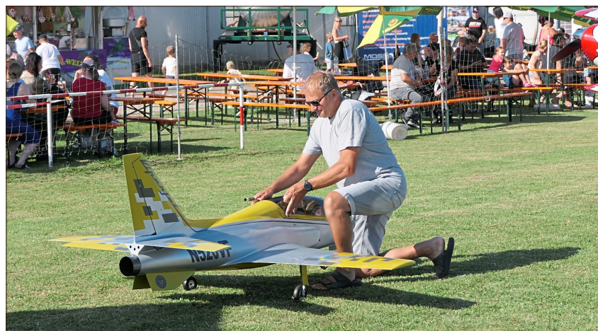
Modell-Flieger waren auch vor Ort.