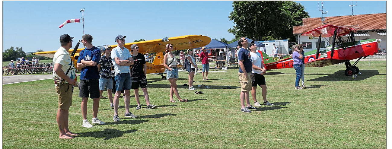
Hoch oben gab es viel für die Besucher zu sehen.