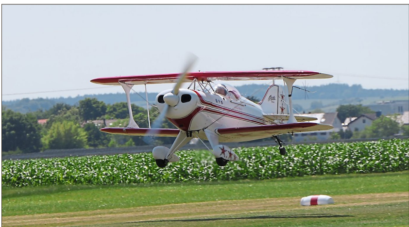
Viele Starts konnte man beobachten.