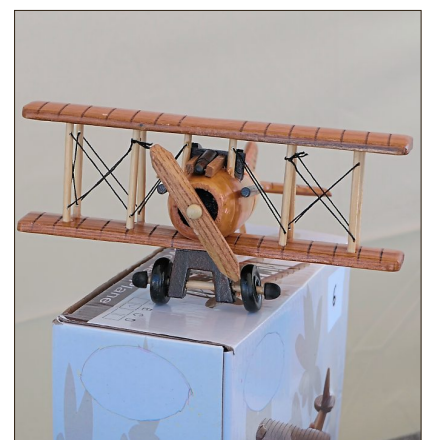
Eine Mini-Version aus Holz.