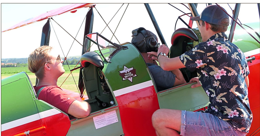
Man konnte auch selbst einmal mitfliegen und Dingolfing von oben genießen.