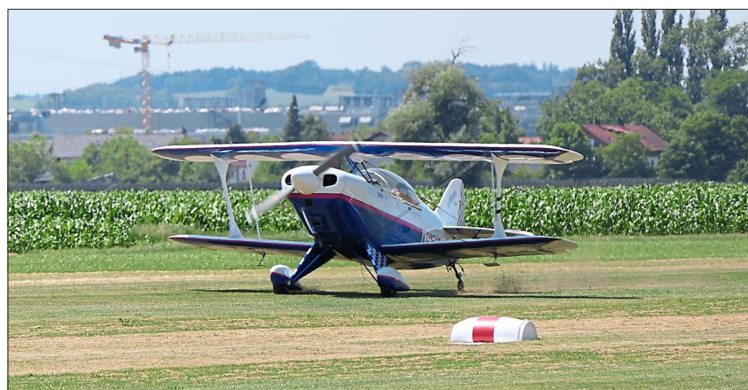
Auch mit dieser Maschine ging es los.