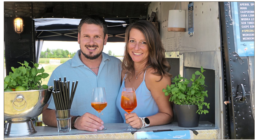
Neu war eine Bartheke in einem Hubschrauber.